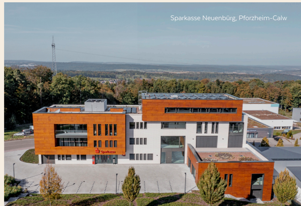
Sparkasse Neuenbürg, Pforzheim-Calw